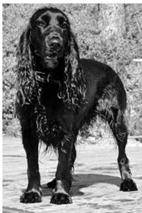
Field španěl Caino právě aportoval kořist z vody.

počátkem 19. století, dávno předtím, než se stal realitou chov psů pouze jako společníků, ovšem upozorňoval Dalziel: „Španěl je velmi oblíbený i jako společník a domácí pes, k čemuž ho nápadně předurčuje jeho bdělost, bystrost a věrnost ruku v ruce s jemnými mravy a krásným vzhledem.“