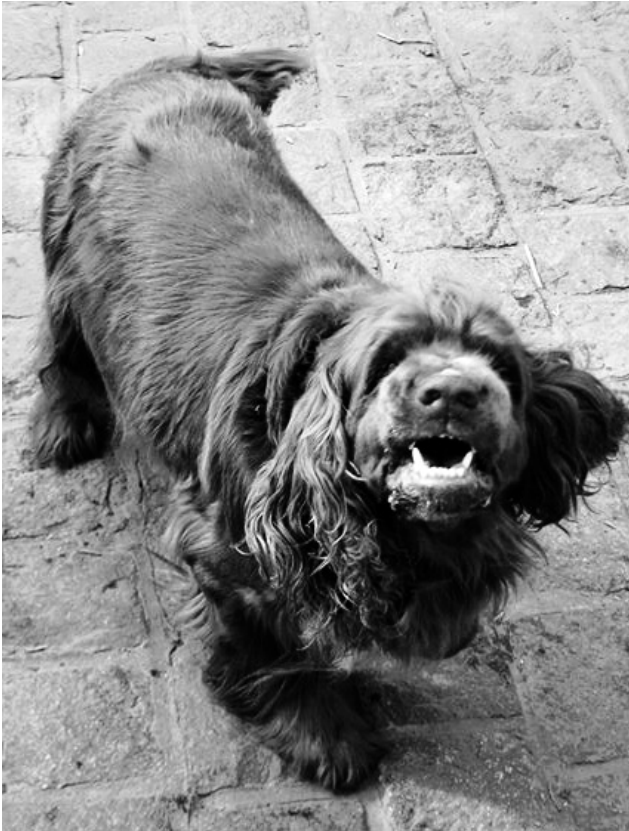
Španělé jako Sussex španěl Jack jsou krásní radostní lovci i rodinní společníci.

nebo sokoly podobně jako jejich příbuzní španělé. S příchodem pušek, které mohla přenášet a používat jedna osoba, začali být setři cvičeni pro lov s puškou. Gordonsetři, irští setři a angličtí setři byli vyšlechtěni pro potřeby jedinečného prostředí a konkrétní kořisti ve svých lokálních oblastech lovu.