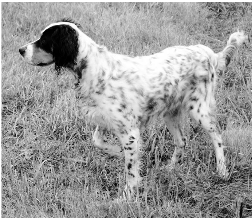
Fenka anglického setra Eva instinktivně znehybní, když zachytí pach ptáka.

ostrovy. Na jednom obraze připisovaném Tizianovi (1477–1576) najdeme psa podobného ohaří, což nasvědčuje tomu, že tito psi byli známi již v 15. století a na evropském kontinentě možná existovali i dříve, i když do Velké Británie se pravděpodobně dostali až počátkem 18. století. Tam byli původní ohaří shledáni příliš těžkými a pomalými na to, aby splňovali potřeby lovců, takže bylo toto plemeno dál upravováno. Soustředěnost a intenzita, s níž pracovala většina ohařů, způsobovala, že nebyli pro lovce tak dobrými společníky a že byli odtažitější než ostatní lovecká plemena. Co se týče fyzických vlastností a vývoje ohařů, najdeme v knize Hughu Dalziela British Dogs tento popis od historika plemen G. Thorpe-Bartrama: