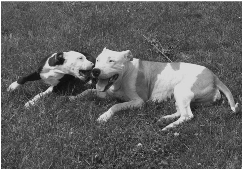
Komunikace mezi psy je klíčová pro udržení pořádku ve smečce.

se všemi psy na celém světě. Pokud dovezete psa z Austrálie nebo z Afriky, můžete si být jisti, že bude schopen porozumět psům, které máte doma, a oni budou rozumět jemu. To je téměř magické!