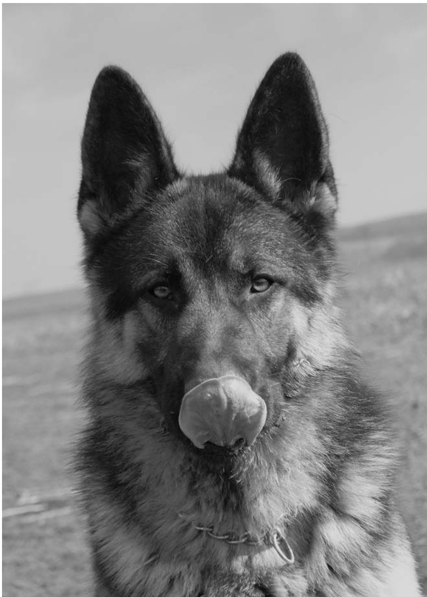
Olíznutí je často jedním z prvních signálů, které pes vyšle.