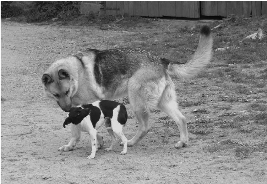
Při nenadálém setkání vysílá pes konejšivý signál tím, že se například k druhému otočí zadkem.

Pes používá tento signál v mnoha situacích: když přiběhne jiný pes příliš zprudka a rychle, když se zlobíte a vypadáte našťavaně, když přicházíte s očividným úmyslem ho potrestat nebo být jinak nepříjemný, když mladí psi otravují dospělé jedince... Pokud táhnete za vodítko a psovi nadáváte, pootočí se, jak nejlíc může, aby vás ukonejšil. Nevysílá tyto signály proto, aby vám naznačil nadřazenost, vůdcovství nebo aby vás ovládl – pokouší se vši silou odvrátit konflikt.