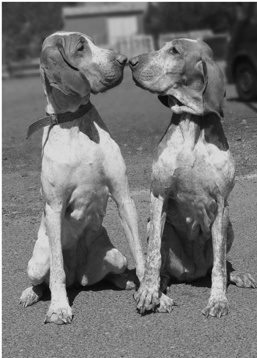
Tak blízký kontakt je možný pouze mezi psy, kteří si navzájem důvěřují.