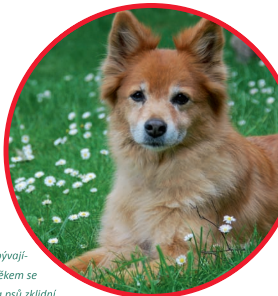
S přibývajícím věkem se většina psů zklidní.

Když pak konečně dospěje, tak se mnohdy zase zklidní a s každým dalším rokem života je čím dál vyrovnanější. U hyperaktivních psů tomu tak ale nemusí být vždycky. Určité schopnosti (např. uvedená kontrola impulzů) se nevynoří jen tak z ničeho nic – pes se je musí naučit. Proto se může stát, že se z obtížně zvladatelného mladého psa stane ještě obtížněji zvladatelný dospělý: tělesně je silnější a chování už má pevně vštípené.